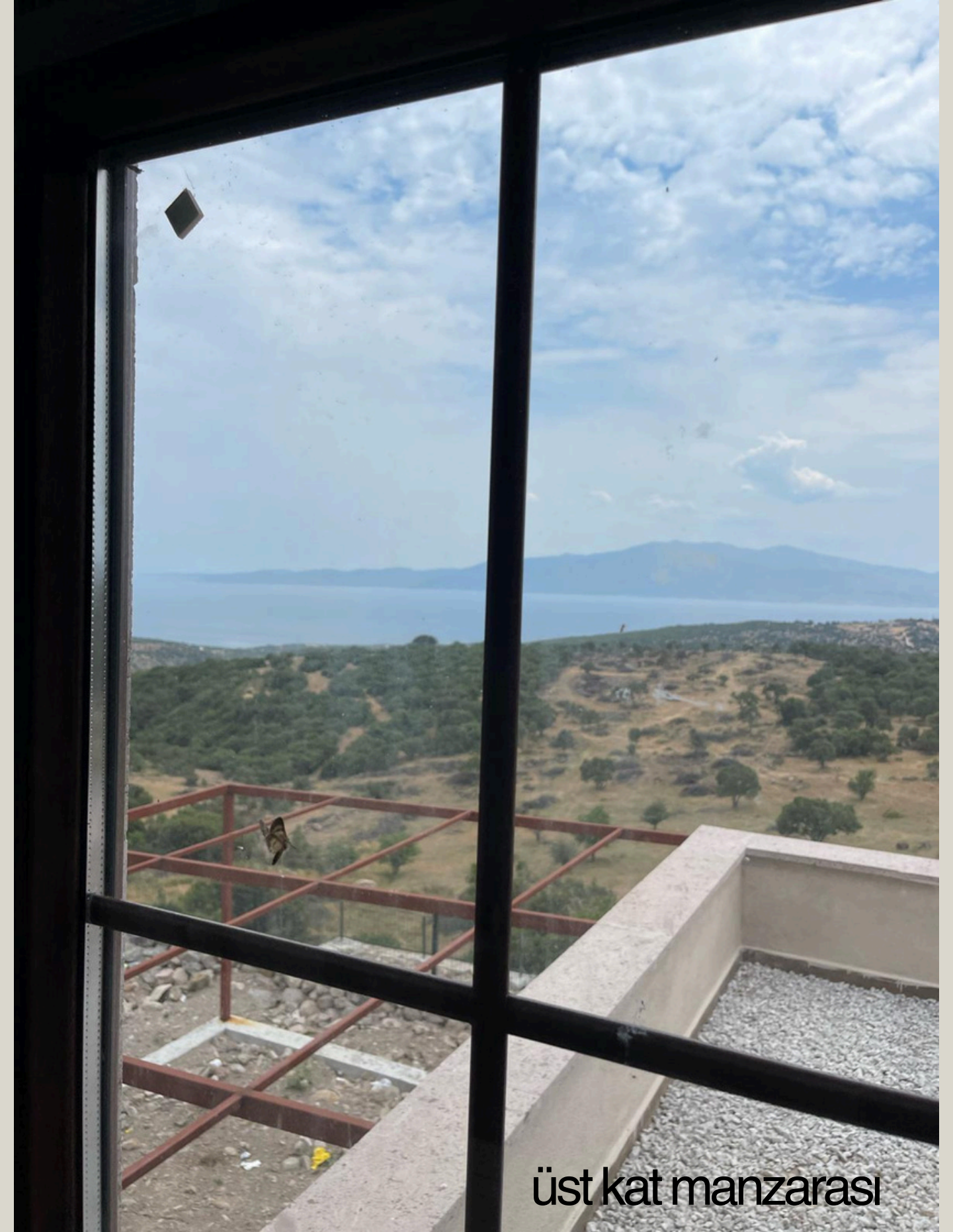
üst kat manzarası