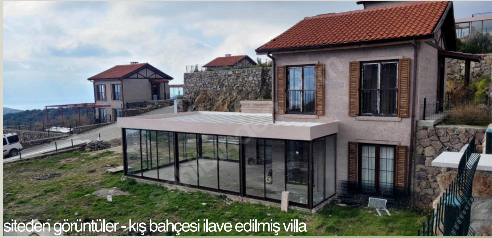
siteden görüntüler - kış bahçesi ilave edilmiş villa