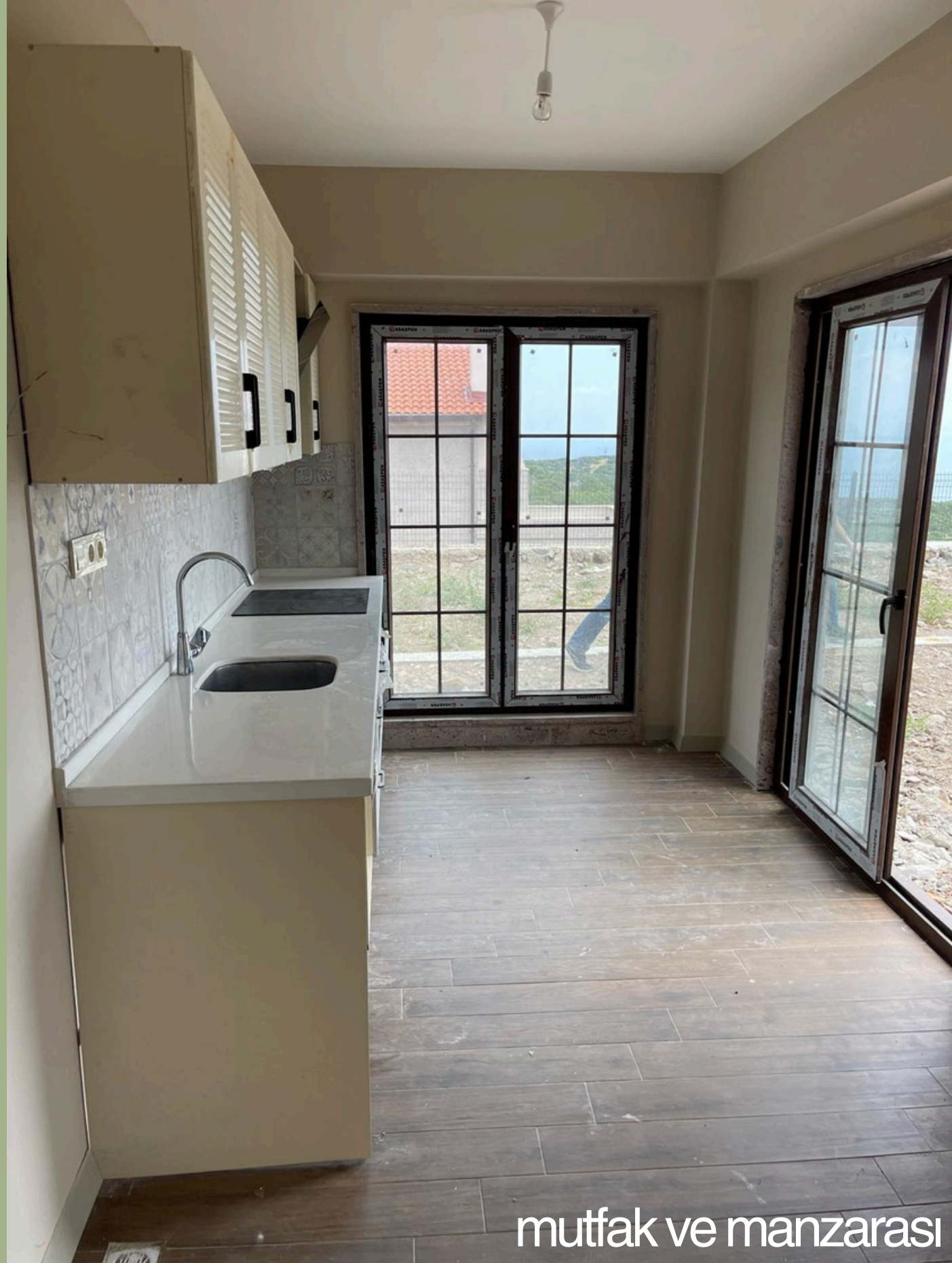
mutfak ve manzarası