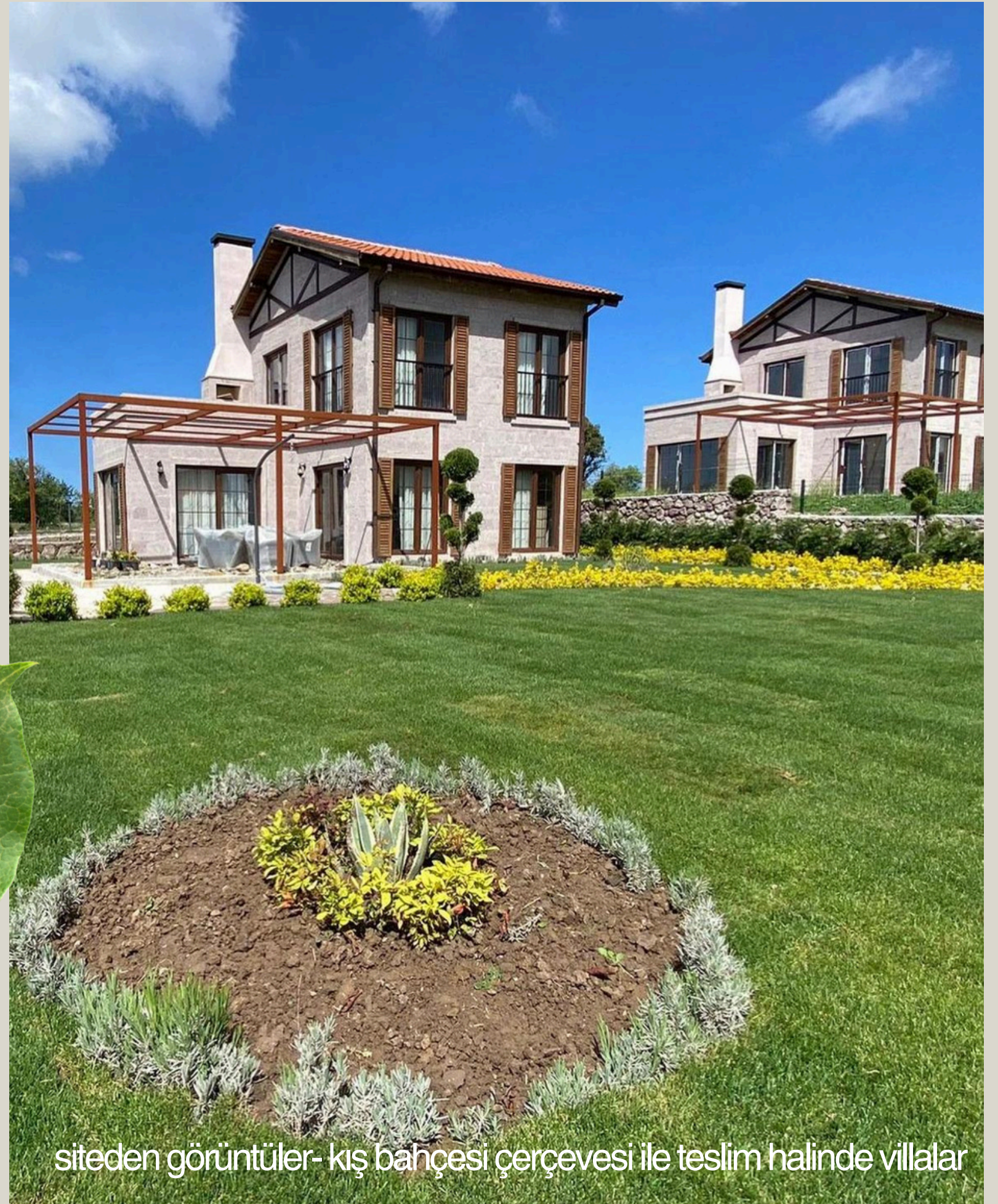
siteden görüntüler- kış bahçesi çerçevesi ile teslim halinde villalar